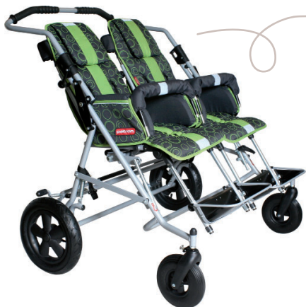
Tom 4 duo Poussette double Réf. 02268 Disponible sur demande