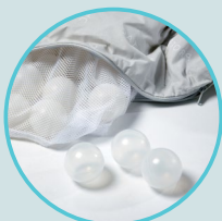
Diamètre des balles : 50 mm

Plusieurs projets de recherche prouvent que dormir avec la Protac Ball Blanket® réduit la latence d'endormissement, réduit les réveils nocturnes et procure un sommeil profond et non perturbé. Une bonne nuit de sommeil améliore le niveau de fonctionnement quotidien et la qualité de vie. Protac Ball Blanket® est enregistré CE en tant que dispositif médical de classe I.