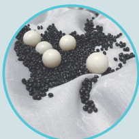
Diamètre des balles : 15 mm

Cette couverture contient à la fois des balles et des granulés de polypropylène, également répartis en compartiments pour offrir une stimulation uniforme sur tout le corps. Cette couverture convient aux personnes qui ont besoin d'une stimulation sensorielle variable, d'une douceur et d'un confort accrus grâce à la doublure thermique.