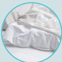
Diamètre des balles : 50 mm

Les balles Protac sont placées dans des canaux . Cela permet une stimulation sensorielle prévisible, apaisante et uniforme, et la couverture se referme agréablement autour de l'utilisateur. La couverture Calm est particulièrement adaptée aux personnes qui ont besoin d'une pression tactile profonde, mais qui sont également sensibles ou stressées par un toucher léger.