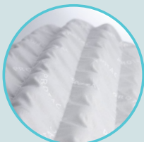
Diamètre des balles : 38 mm

Les balles Protac sont divisées en compartiments où elles peuvent se déplacer et fournir une stimulation sensorielle dynamique. Ce modèle convient aux personnes en quête de sens qui ont besoin d'un apport sensoriel varié pour se sentir en paix avec soi-même, pour trouver le sommeil ou passer un moment calme.