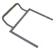
Arc de serrage